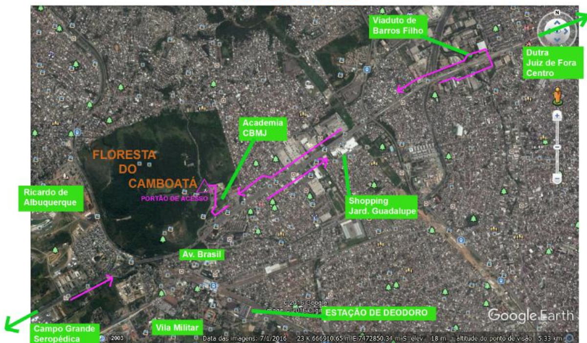
CROQUI DE ACESSO

OBS: O ACESSO A ESTRADA DO CAMBOATÁ QUE DÁ ACESSO AO PORTÃO DE ENTRADA DEVERÁ SER REALIZADO OBRIGATORIAMENTE PELA AV. BRASIL, SENTIDO CENTRO-CAMPO GRANDE